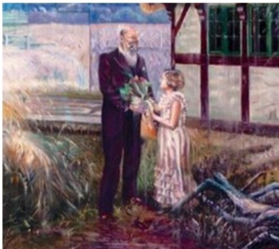
Mindre udsnit af et af de 7 store detailmættede billeder fra Socialdemokratiets gruppeværelse.

Tilbage i ”før-corona-tid” havde vi i Hedensted Partiforening planlagt en tur til Christiansborg d. 16. maj 2020. Her skulle vi bl.a. se og høre om de 7 meget store historiske billeder i det Socialdemokratiske gruppeværelse. Turen blev allerede annonceret i december 2019 ved i Nyhedsbrevet at vise nedenstående billede: