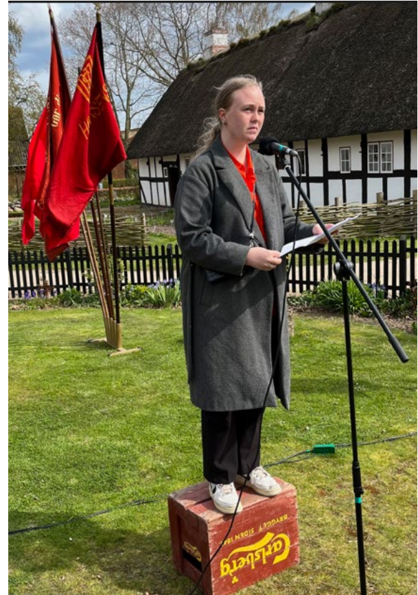
Lenea på talerstolen 1. maj.