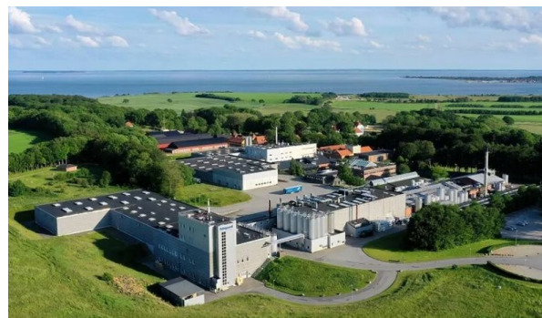
Overblik over Palsgaards industribygninger